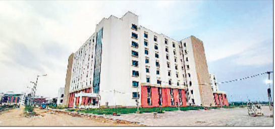
नारनौल। कोरियावास में बनाया गया मेडिकल कॉलेज एवं अस्पताल।

नववर्ष 2024 से जिलावासियों को बहुत ही उम्मीदें हैं। सबसे बड़ी उम्मीद कोरियावास में बनाए जा रहे मेडिकल कॉलेज एवं अस्पताल से है, जिसके इस साल चालू होने की पूरी संभावनाएं हैं। इसके साथ ही जिला औद्योगिक क्षेत्र की दिशा में भी कदम बढ़ा रहा है। सड़कों का नया जाल लगभग तैयार है तथा नारनौल-महेन्द्रगढ़-दादरी सड़क मार्ग भी अब इस साल नया बनकर तैयार हो जाएगा। इससे लोगों की मुश्किलें कम होंगी तथा उन्हें बेहतर जीवन मिल सकेगा।