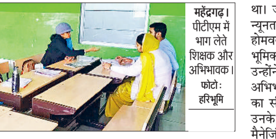
महेंद्रगढ़ में पीटीएम में भाग लेते शिक्षक और अभिभावक।