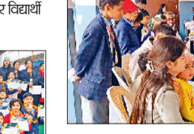
महेंद्रगढ़। पीटीएम में भाग लेते शिक्षक और अभिभावक।