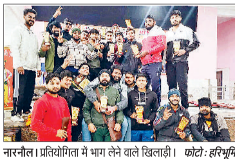
नारनौल। प्रतियोगिता में भाग लेने वाले खिलाड़ी।