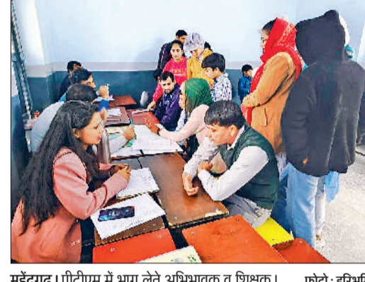
महेन्द्रगढ़। पीटीएम में भाग लेते अभिभावक व शिक्षक। फोटो: हरिभूमि

महेन्द्रगढ़। गांव जागरूकता रैली निकालते संगठन के सदस्य। फोटो: हरिभूमि आर्थिक नुकसान भी पहुंचता है। इससे घर में शांति भंग होती है तथा विकास बाधित हो जाता है। संगठन के सदस्यों ने ग्राम पंचायत बवानिया के साथ मिलकर गांव को नशा मुक्त करने का न केवल अभियान चलाया, बल्कि भविष्य में गांव को बिल्कुल नशा मुक्त करने का भी संकल्प लिया। संगठन के सदस्यों ने अपने संदेश में बताया कि नशा एक ऐसी लत है, जिससे न केवल घर बर्बाद होता है, बल्कि समाज भी अंदर से खोखला हो जाता है।